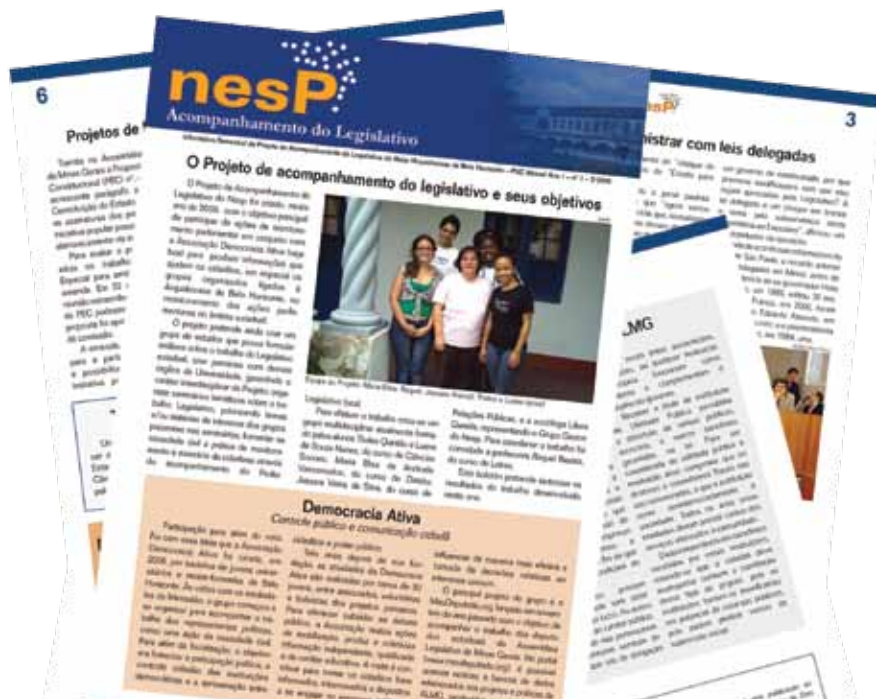
Reprodução do boletim informativo do Projeto de Acompanhamento do Legislativo do NESP

O boletim apresentava, portanto, o conteúdo produzido pelo GAL, mas também se constituía como estratégia de promoção do interesse de grupos diversos a se organizarem para o mesmo fim. Para conhecer os boletins publicados, acesse www.pucminas.br/nesp .