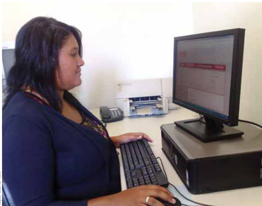
Estagiária do NESP em atividade de acompanhamento não presencial da Câmara Municipal de Vereadores de Belo Horizonte