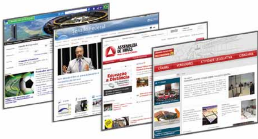
Sites das casas legislativas

Abaixo, reproduzimos imagens de sites de casas legislativas, que podem ser utilizados nos diferentes modos de organização do trabalho de acompanhamento.