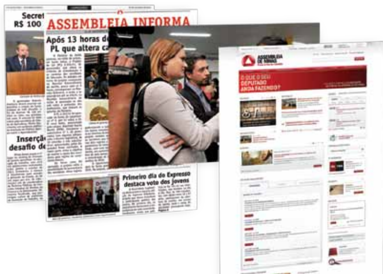
Veículos de comunicação utilizados pela ALMG

cobertura ao vivo das reuniões de plenário, além de noticiários, debates e mesas-redondas.